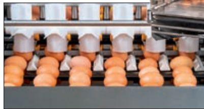
Ausgeklügte Technik sorgt dafür, dass alle Eier einheitlich ausgerichtet sind, bevor sie ins Karussell gehen