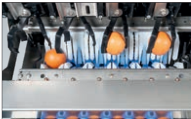
Das Dropset legt die Eier vorsichtig in die Höcker