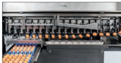
Horizontales Karussellsystem für optimalen Eiertransport und eine zuverlässige Bedruckung