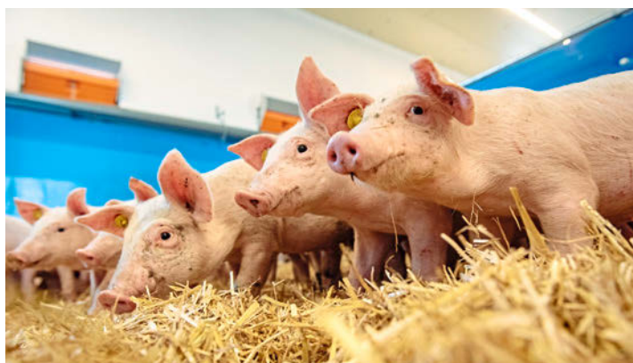
Piglets on straw. Literally as “happy as pigs in muck”. A sophisticated climate control system guarantees that rising moisture is constantly removed from the house.