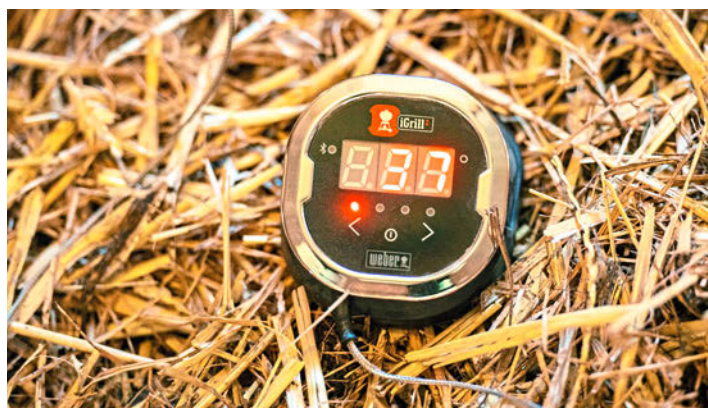
The temperature of the bedding is between 35 and 40°C. The moisture in the straw layer evaporates, keeping the bedding dry.