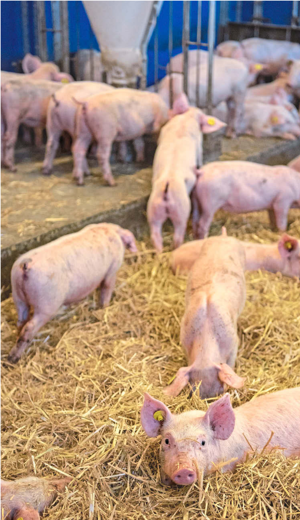
Die Futter- und Wasserversorgung der Tiere erfolgt auf einem Podest.