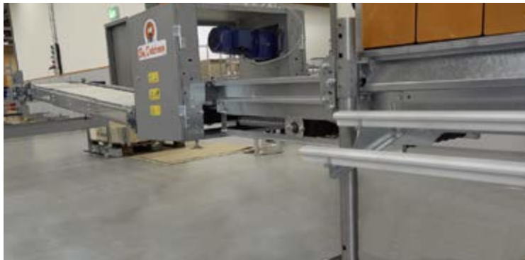
Eierbandantrieb EggTrax sorgt für eine sichere Eiübergabe in jeder Höhenposition